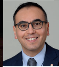
Franck GHERBI Maire d'Hellemmes