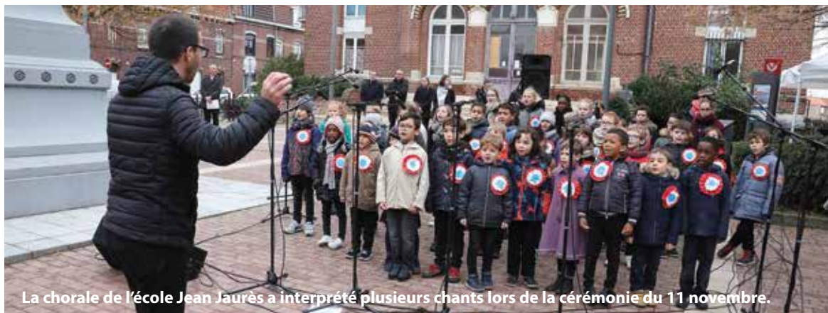
La chorale de l'école Jean Jaurès a interprété plusieurs chants lors de la cérémonie du 11 novembre.

Accompagner les jeunes au quotidien, c'est un des enjeux principaux de la Municipalité. Faciliter leurs démarches, favoriser l'orientation, permettre un accès à la culture, soutenir les projets citoyens et humanitaires, proposer des activités adaptées dans les quartiers, offrir des possibilités de s'épanouir... la commune d'Hellemmes veille à développer chez les jeunes l'esprit d'initiative, le sens de l'investissement et l'apprentissage du vivre ensemble. Cet engagement se traduit par la mise en place de plusieurs types d'activités et de projets, pour les ados, dont la construction est partagée entre les jeunes et les animateurs référents de l'Espace Jeunes.