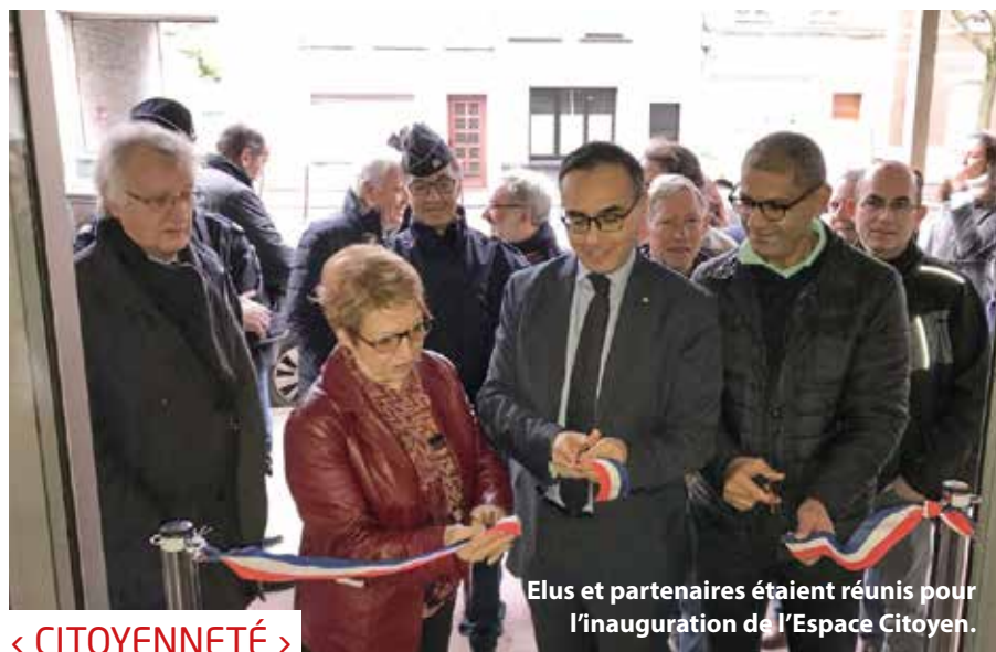
Elus et partenaires étaient réunis pour l'inauguration de l'Espace Citoyen.