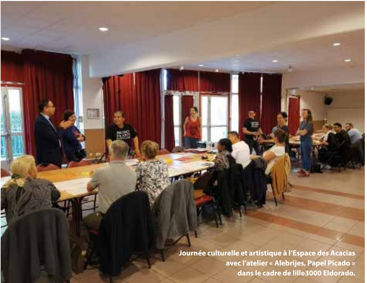
Journée culturelle et artistique à l'Espace des Acacias avec l'atelier « Alebrijes, Papel Picado » dans le cadre de lille3000 Eldorado.