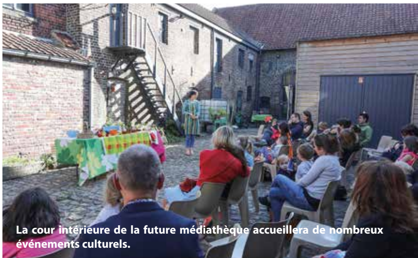
La cour intérieure de la future médiathèque accueillera de nombreux événements culturels.

Point central du Plan Lecture, la bibliothèque communale, bien que très prisée et appréciée, ne correspond plus aux attentes des Hellemmoises et des Hellemmois. Aussi, la Municipalité a décidé de créer un nouvel équipement qui sera la figure de proue du dispositif. Confortable et spacieuse (600 m 2 ), la future bibliothèque sera le fruit d'une consultation menée auprès des futurs usagers, ainsi que d'une recherche en matière de design, de lumière, de mobilier et d'accessibilité. Installée dans l'ancien corps de ferme du 48 rue Faidherbe, bâtiment emblématique du patrimoine communal, elle sera un véritable marqueur urbain, attractif, qui donnera toute sa lisibilité au Plan. Si les livres, la presse, DVD, CD et autres documents, ressources, point numérique ou services y seront en accès libre, le site se voudra également un lieu de débats, d'activités culturelles et de formation, qui pourra accueillir une programmation événementielle.