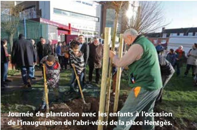
Journée de plantation avec les enfants à l'occasion de l'inauguration de l'abri-vélos de la place Hentgès.

d'initiative et au sens des responsabilités développé, qui a créé le Club Nature. Une dizaine de jeunes Hellemmois se réunissent un mercredi sur 2. En s'amusant, en bricolant, ils apprennent à reconnaître les arbres et les plantes, à aimer la nature, à la découvrir, à mieux la comprendre et à la protéger au travers de gestes simples. Ils construisent des nichoirs pour les oiseaux, des abris pour les insectes, s'investissent dans les jardins partagés, s'associent et participent aux manifestations communales et associatives en rapport avec l'environnement, sont consultés, donnent leur avis sur les sujets environnementaux et participent activement aux campagnes de plantations d'arbres, comme ce fut le cas le 22 décembre dernier à proximité du nouvel abri vélo sur la place Hentgès.