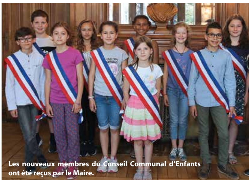
Les nouveaux membres du Conseil Communal d'Enfants ont été reçus par le Maire.

Certains s'engagent donc dans les structures existantes, tandis que d'autres n'hésitent pas à aller encore plus loin en créant leurs propres associations. C'est le cas d'un petit groupe d'ados plein de projets en tête, à l'esprit