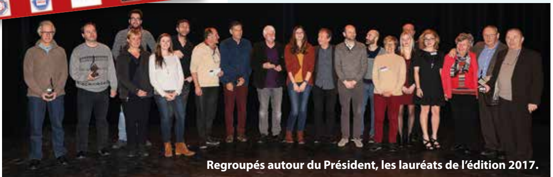
Regroupés autour du Président, les lauréats de l'édition 2017.

Ancienne Mairie Place de la République 59260 Hellemmes contact@lmcv.fr