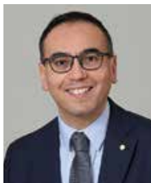
Franck GHERBI, Maire d'Hellemmes