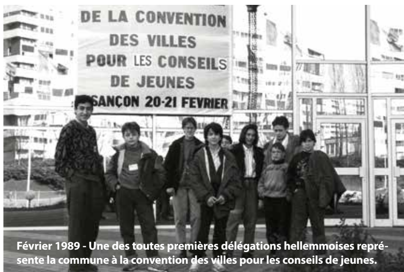
Février 1989 - Une des toutes premières délégations hellemmoises représente la commune à la convention des villes pour les conseils de jeunes.

D'après l'Anacej qui regroupe des communes ayant créé un de ces conseils, il en existerait actuellement 2000 sur l'ensemble du territoire national.