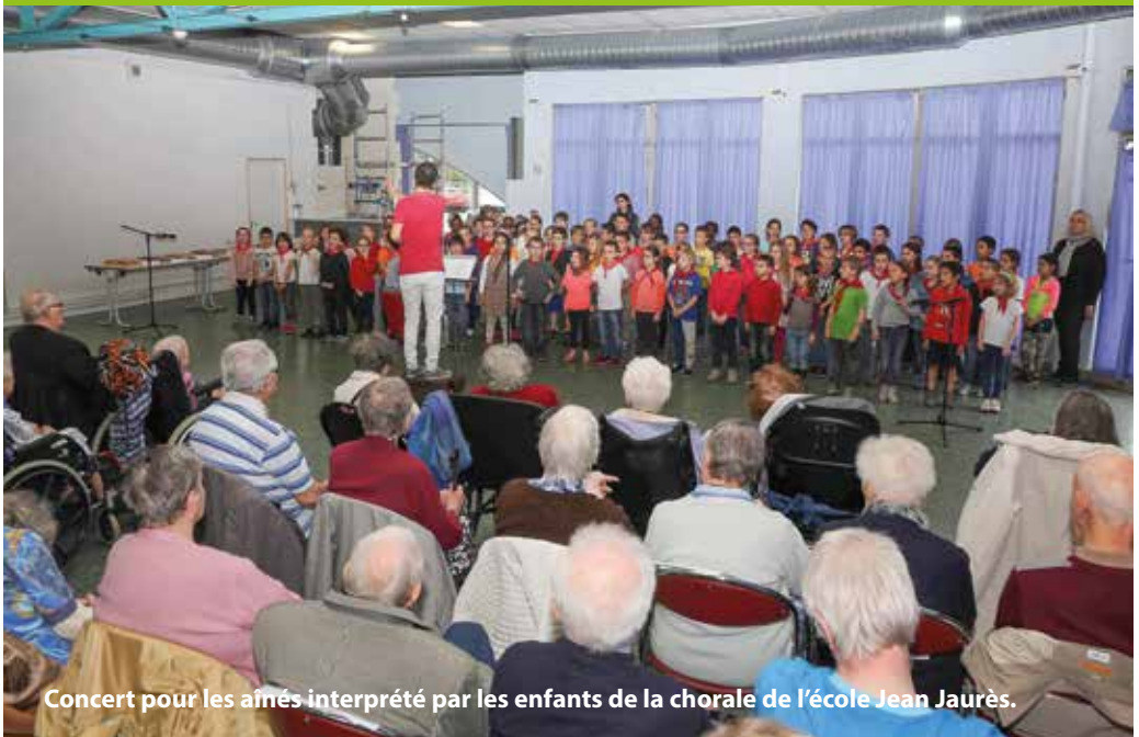
Concert pour les aînés interprété par les enfants de la chorale de l'école Jean Jaurès.

Des actions Intergénérationnelles sont développées en lien avec les écoles communales Berthelot-Sévigny, Jean Jaurès et Saint Joseph. En lien avec l'association « Zéro Déchet », une action liée au développement durable et à la nature en ville devrait prochainement être engagée autour de la création d'un potager partagé. Le jardin rassemblera les usagers du CCAS, des familles des crèches communales et les seniors qui le souhaitent.