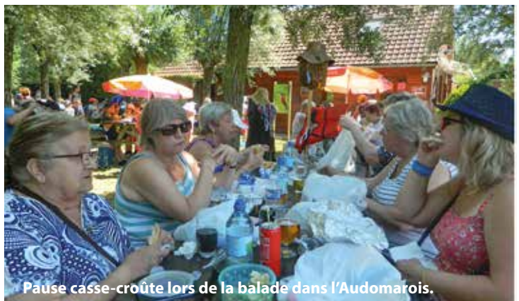
Pause casse-croûte lors de la balade dans l'Audomarois.

La salle polyvalente de l'Espace des Acacias avait déjà des airs de fête le 21 novembre dernier, à l'occasion du traditionnel repas mensuel des aînés : tables mises en place et dressées par l'équipe de l'Espace Seniors, ajoutez près de 150 participants, un pincée de bonne humeur et entre chaque plat concocté par le traiteur Ghysel, tangos, charlestons, valse et madisons interprétés avec dextérité par le fantaisiste Dany Duke... Une recette gagnante pour une journée très conviviale, un temps de pause pour se rencontrer, échanger et partager un moment festif qui a été apprécié de tous.